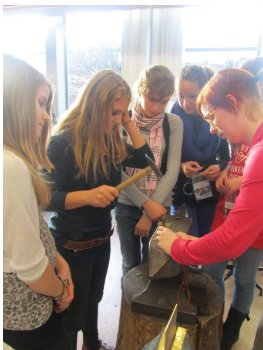
Iedereen moest ook zelf met de hamer zijn sleutelhanger bol slaan. En dat was zo makkelijk nog niet!