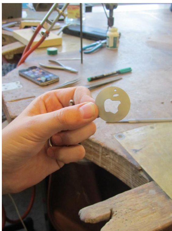
En zie hier het resultaat!